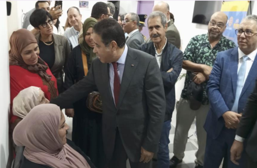
Les malades et leurs familles remerciant Mr le Gouverneur